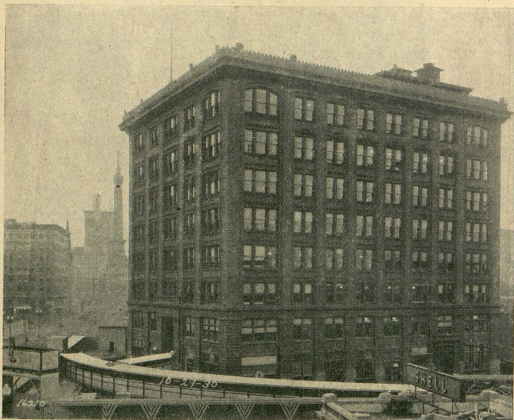
Das Fernsprechamt in Indianapolis vor dem Umzug