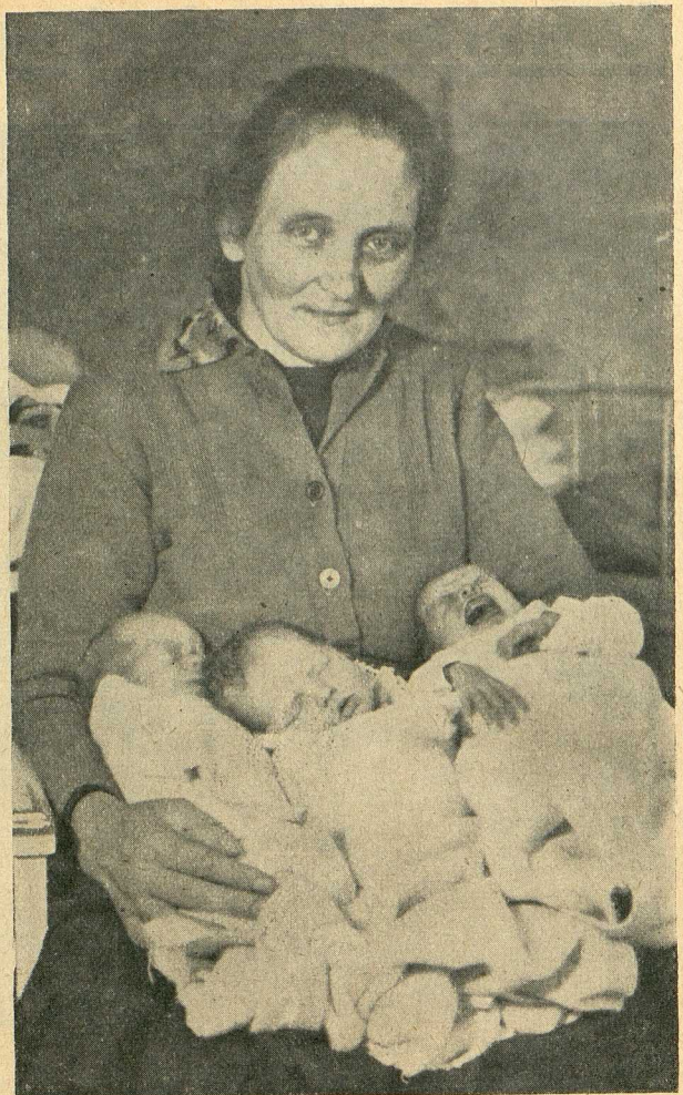
Ein „Drillingskristkindl“ in Wels

Der langjährige Direktor des Linzer Waisenhauses feierte am 15. Jänner seinen 70. Geburtstag