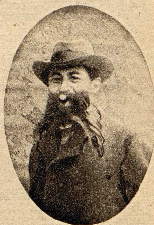
Arthur Stadthagen †. Der Reichstagsabgeordnete Arthur Stadthagen, der auch Berliner Stadtverordneter und einer der unabhängigen Sozialdemokraten war, ist an einem Lungentod gestorben.