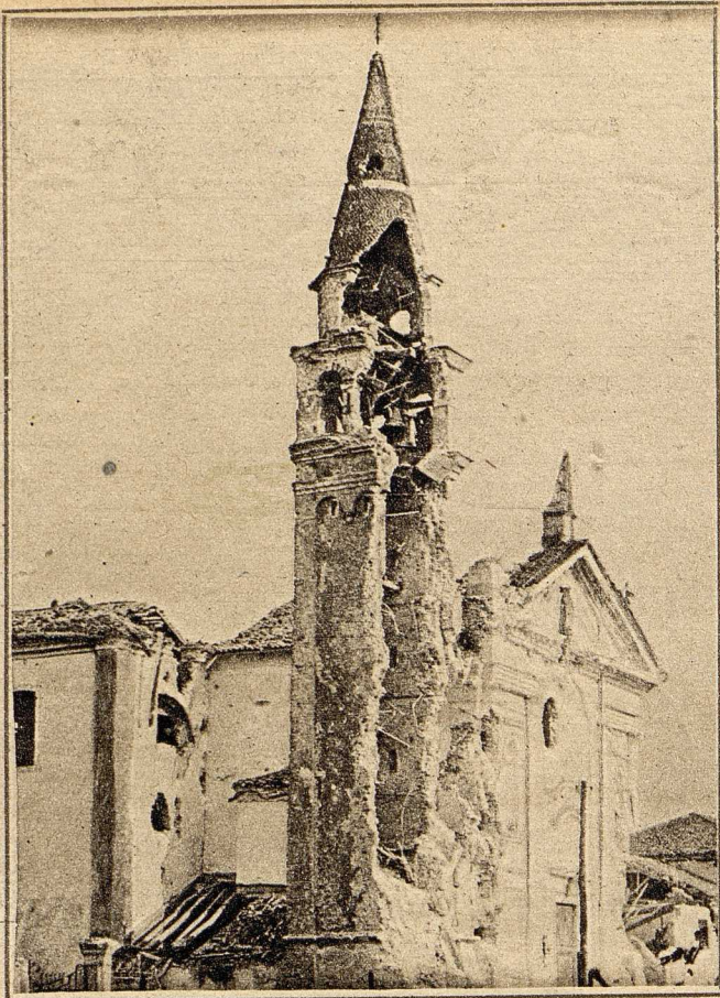
Der „aufgeschlagte“ Kirchturm in Ponte di Biave!