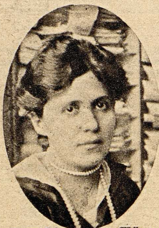
Frau Direktor Dr. Wörner zählt zu den wenigen Frauen, die an der Spitze eines kriegswichtigen Wertes stehen und hat als Leiterin der Algot Flugzeugwerke das Verdienstkreuz für Kriegshilfe erhalten.