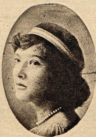
Zur Flucht der Großfürstin Tatjana aus Sibirien: Die zweite Tochter des entthronten Zaren, Großfürstin Tatjana, ist laut Havas-meldungen aus Sibirien entwichen, um nach Amerika zu gelangen.