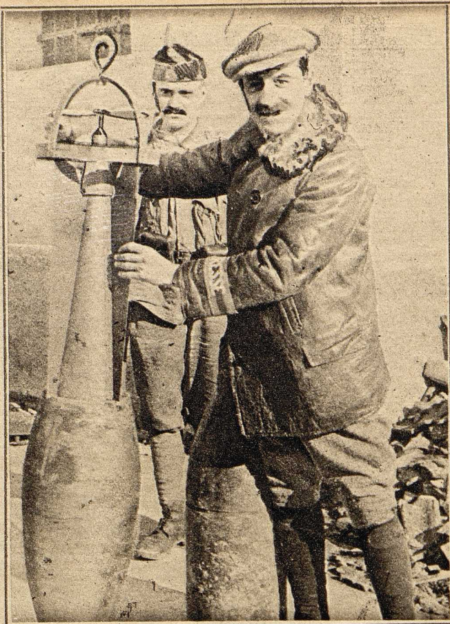
Italienische Fliegerbombe. Die Bombe hat im untern Teil eine Zelle zur Aufnahme giftiger Gase.