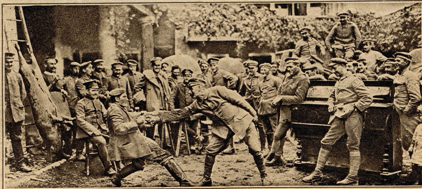
Im besetzten Vittorio. Schlachtfest bei den Bayern: Beim Fingerhakeln.