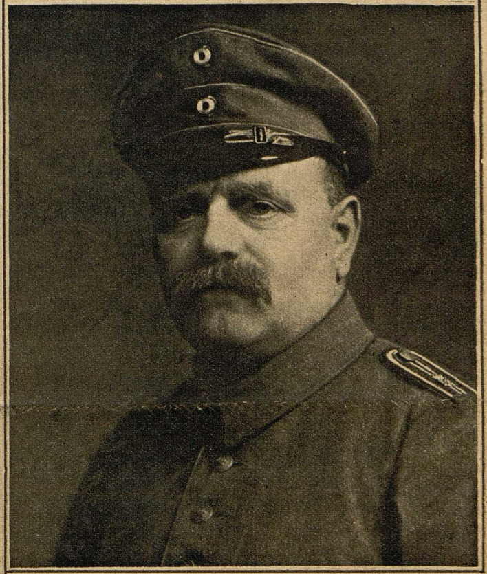
Reichstagsabgeordneter Giesberts, der zukünftige Unterstaatssekretär des neuen Reichswirtschaftsamtes.