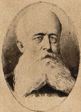
General Raschtalinski wurde bei den jüngsten Unruhen in Petersburg ermordet. Er war ein altverdieneter russischer Mi- litär, der besonders im russisch- japanischen Kriege sich aus- gezeichnet hat.