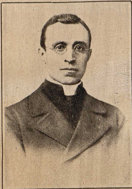
Der neue apostolische Nuntius in Bayern, Monsignore Pacelli. Monsi. Pacelli ist 41 Jahre alt und Dr. der Theologie, der kirchlichen und Zivil-Rechte.