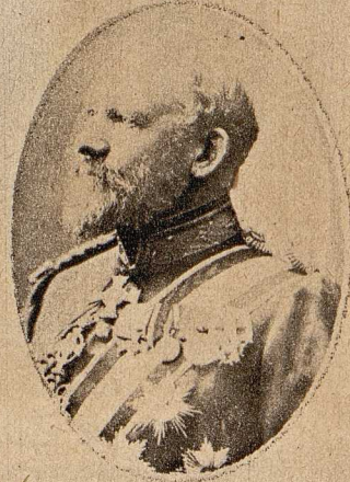
General der Inf. z. D. Emil Frhr. v. Meerscheidt-Hüllessem beging den 60jähr. Gedenktage seines Eintritts in die preuß. Armee. Sein Buch „Die Ausbildung der Infan- terie“ ist grundlegend für unser heutiges Exerzierreglement für die Infanterie geworden.