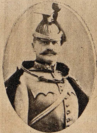
General der Kavallerie Graf von Hugn, der neue Statthalter in Galizien.