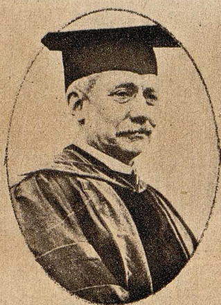
Der amerikanische Senator Root erhielt den Rang eines außer- ordentlichen Botschafters in Rußland.