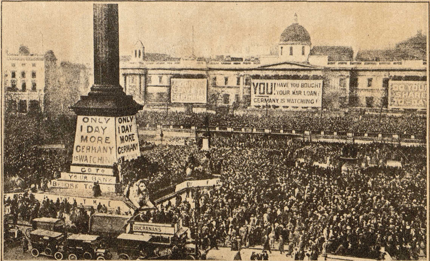
Kriegsanleihe-Meetings in London auf offener Straße.

Im Laufe der Kriegsjahre hat auch der Deutsche allmählich eingesehen, daß man Ellenbogen und Stimme nicht unterschätzen darf, wenn man zum Erfolg gelangen will. So haben wir gelernt, daß z. B. die Bedeutung der Kriegsanleihen der Masse durchaus nicht von selbst einleuchtet, sondern daß man sie propagieren muß, wie das die Engländer längst getan haben. Die Auflegung der neuen Anleihe hat Gelegen-