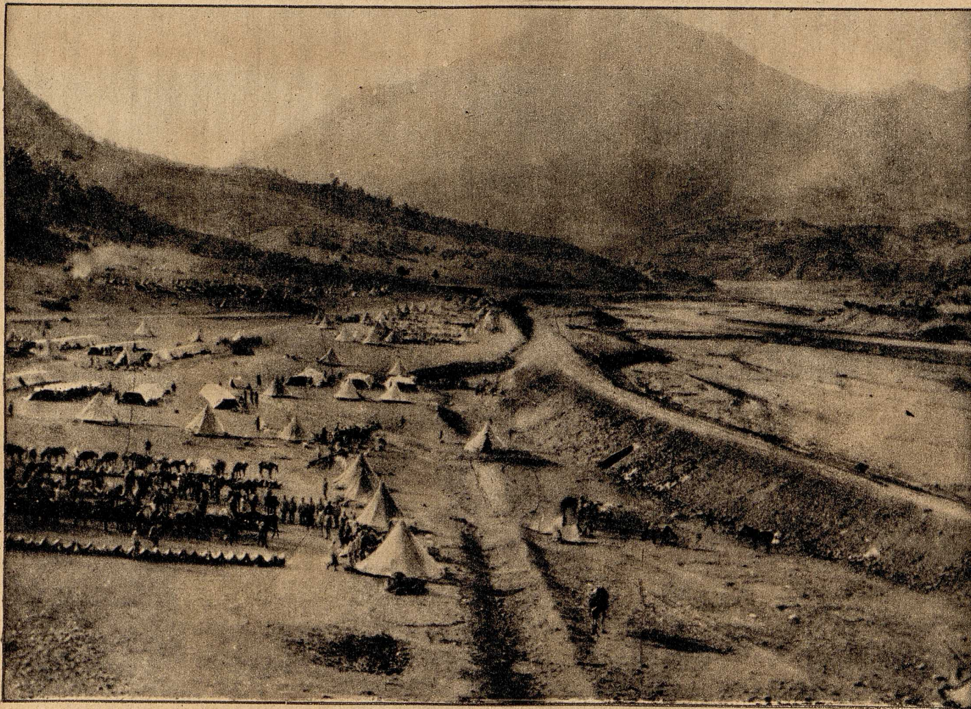
Lager einer türkischen Division im Taurus (Aleinassen).

in Ostafrika, bei denen zwei englische Brigaden vernichtet wurden, die Enthebung vom Oberbefehl verursacht. Nach der „Kölnischen Volkszeitung“ wurden nämlich im Oktober und November die beiden Brigaden des Unterführers Northey nahezu völlig bezwungen. Die übrig bleibenden Reste retteten sich unter Hinterlassung einer zahlreichen Bagage durch tagelange Flucht; schlimmer noch erging es den Truppen des Obersten Bagendale, dessen 2800 Mann in mehrwöchigen heftigen Gefechte umzingelt und völlig vernichtet oder gefangen wurden. Der gesamte Geschütz- und Fuhrwerkspark fiel in die Hände unserer Ostafrikaner. Bei den mit beispielloser Erbitterung geführten Kämpfen verlor der Feind über 6000 Mann, 15 Geschütze und 15 Maschinengewehre.