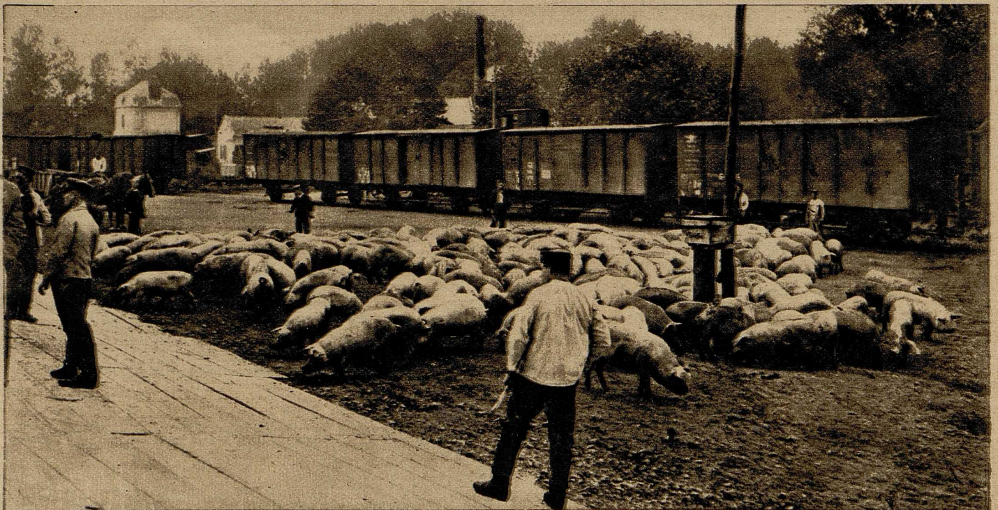
Unten: Antrieb von Schweinen für eine Truppenabteilung auf einem französischen Bahnhof.

Nationen voran. Durch die gründlichste wissenschaftliche Durchbildung unserer Landwirte, durch rastlose Aufklärungs- und Belehrungsarbeit der Bauern haben wir es dahin gebracht, daß der deutsche Boden das Zehn-