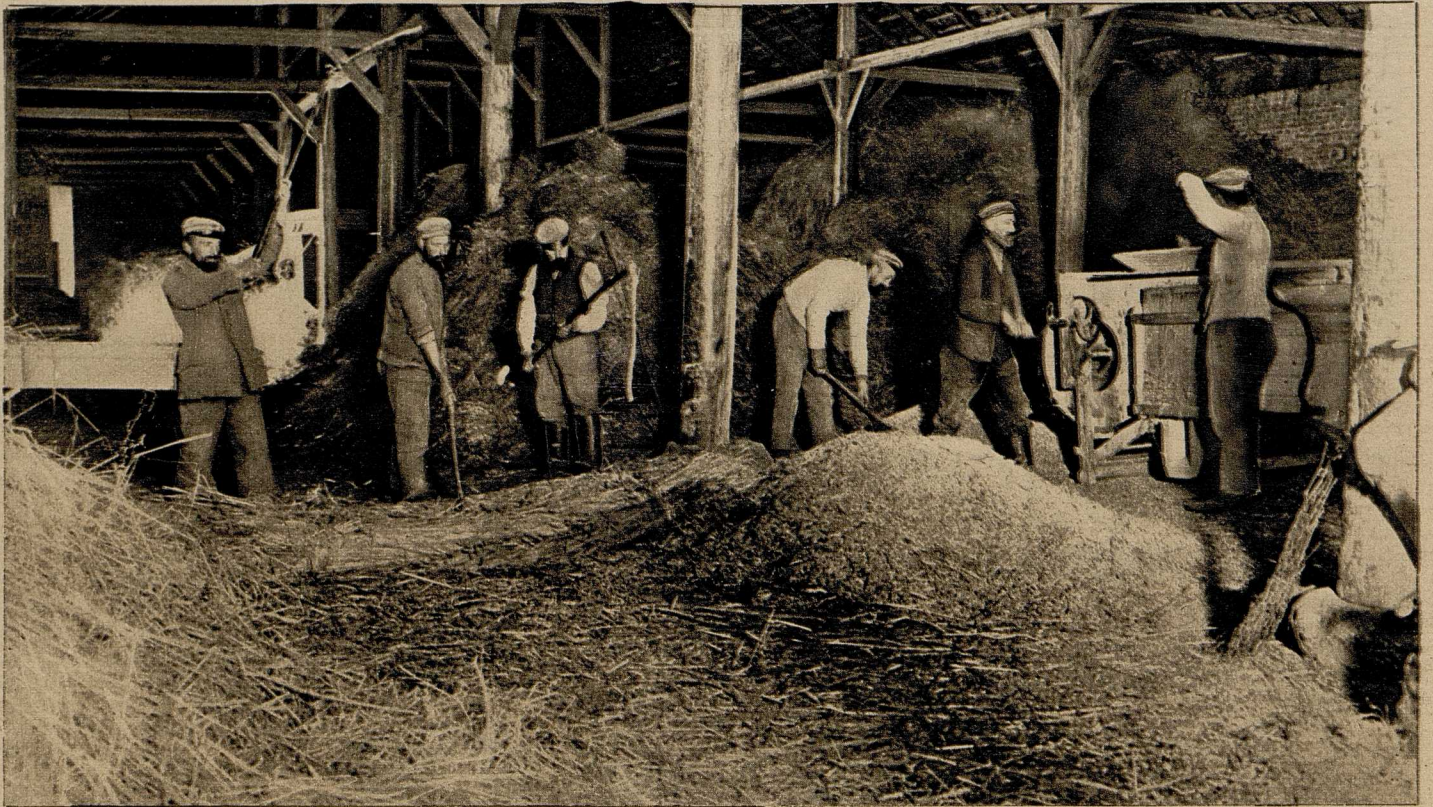
Deutsche Soldaten beim Dreschen des

Noch vor kaum fünfzig Jahren übertrafen uns Engländer, Franzosen und Italiener weit in der Kunst der Bodenausnutzung und der rationellen Viehhaltung und Viehzucht: heute sind wir auch hierin allen anderen