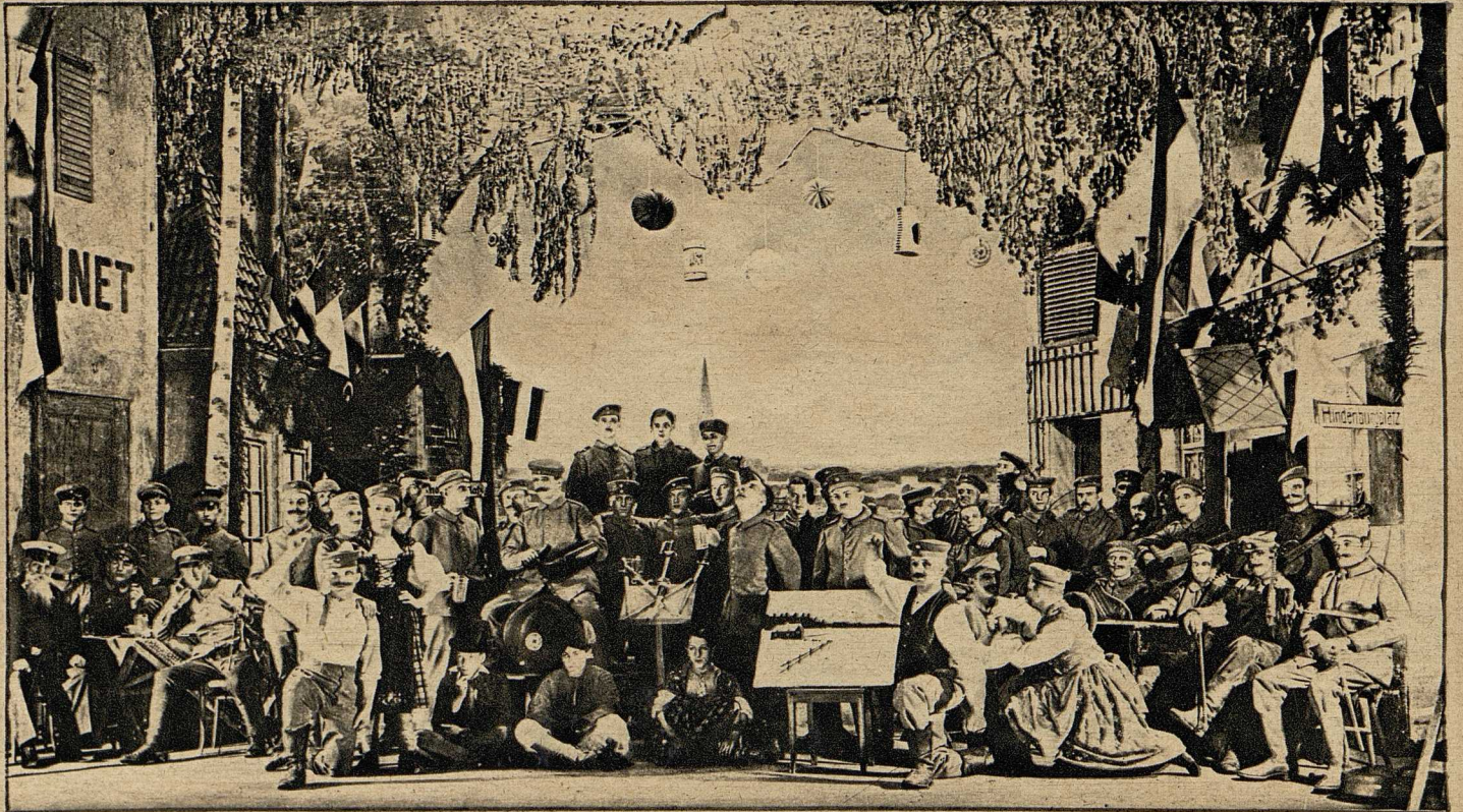
Szene aus dem feldgrauen Spiel „Der Hias“. Die Aufführung geschieht zugunsten des Kriegs-Liebesdienstes von Feldgrauen.