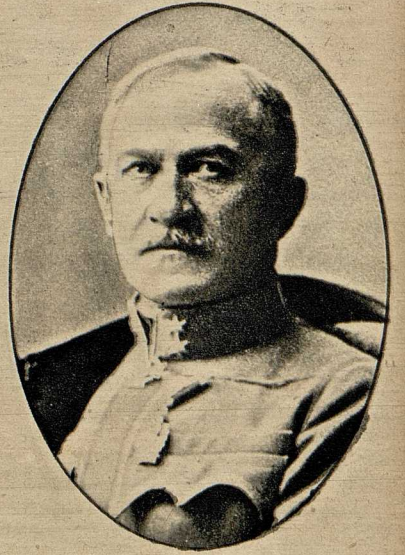
Feldmarschallentnant Súrmay, der vollstümliche ungarische Heerführer.