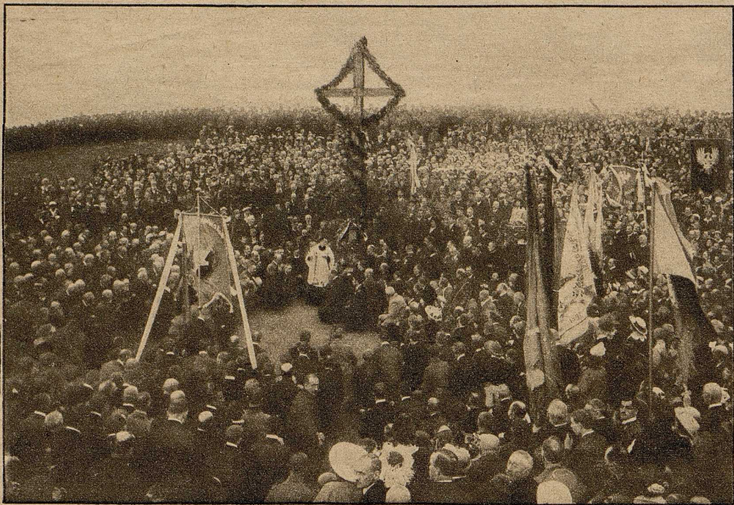
Die polnische Nationalfeier am 5. Aug. 1916 zur Erinnerung an die vor Jahresfrist erfolgte Einnahme von Warschau durch die Deutschen und Beendigung der Russenherrschaft: Feldgottesdienst vor dem zum