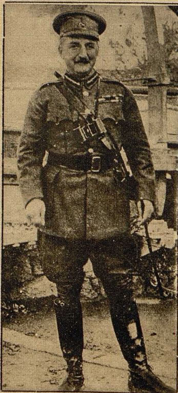
General Sir John Maxwell, der militärische Diktator in Irland.

Ein eigenartiger Umschwung der Lage beginnt sich bei unseren Feinden zu vollziehen: die Aushungerer fangen an, selbst Nahrungsmangel zu leiden. In Frankreich, das sich auf seine Organisation so viel einbildete, fehlt für die Bestellung der Felder längst das nötige Menschenmaterial, während in Deutschland die Ackerbestellung auch in den besetzten Gebieten glatt vorstatten ging. Jetzt klagt auch England, daß ihm für seine Felder Leute mangeln und bemüht sich, Frauen und Kinder dafür zu gewinnen.