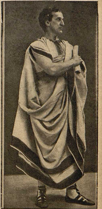
Der zum Ritter geschlagene „Julius Caesar“: Der englische Schauspieler Frank R. Benson wurde während der Aufführung des „Julius Caesar“ vom englischen König zum Ritter geschlagen.