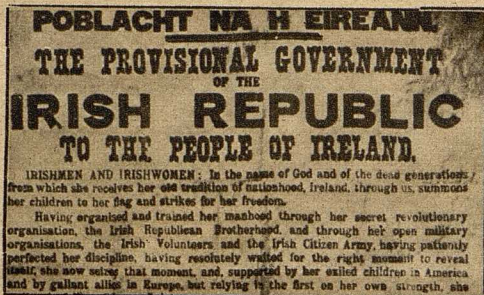
Die Proklamation der irischen Republik.

Ein eigenartiger Umschwung der Lage beginnt sich bei unseren Feinden zu vollziehen: die Aushungerer fangen an, selbst Nahrungsmangel zu leiden. In Frankreich, das sich auf seine Organisation so viel einbildete, fehlt für die Bestellung der Felder längst das nötige Menschenmaterial, während in Deutschland die Ackerbestellung auch in den besetzten Gebieten glatt vorstatten ging. Jetzt klagt auch England, daß ihm für seine Felder Leute mangeln und bemüht sich, Frauen und Kinder dafür zu gewinnen.