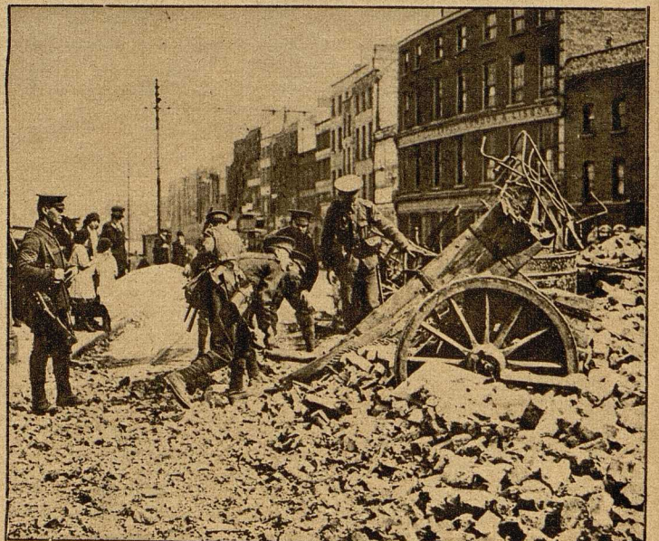
Englische Soldaten beim Durchsuchen der Trümmer einer Barricade, hinter denen sich die Revolutionäre lange hielten.