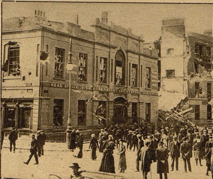
Die zerstörte Freiheitshalle in Dublin. (Die Einschlaglöcher in Wänden und Fenstern zeugen von der Heftigkeit der Beschiesung.)

Wohl ist dem Rufe hier und da, wie unser Bild zeigt, Folge geleistet worden, aber nicht durchgreifend genug, um die Engländer gänzlich von dieser Sorge zu befreien. Daß sie darüber aber auch noch für andere Dinge Zeit und Lust haben, zeigt die Standeserhöhung des englischen Schauspielers Frank R. Benson, die sich im Zwischenakt der Aufführung von Shakespeares „Julius Caesar“ vollzog, wobei der König den Schauspieler im Kostüm seiner Rolle zu sich beschied und ihn eigenhändig zum Ritter schlug.