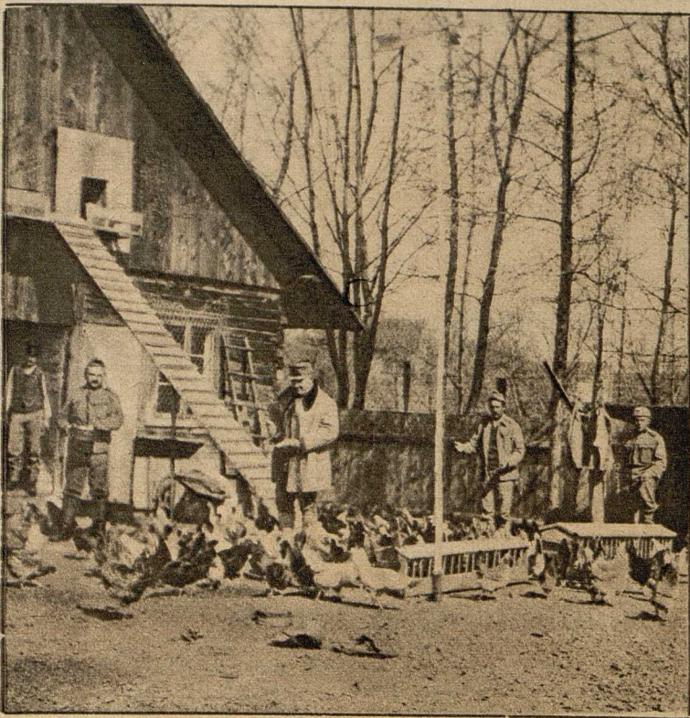
Eine Geflügelfarm hinter der Front. Die Eier werden an die Feldspitäler abgegeben.

Daß die österreichisch-ungarischen und die bulgarischen Truppen in den Albanern gute Helfer haben, ist bekannt. Albanische Freiwillige haben oft genug an ihrer Seite tapfer mitgekämpft, und auch die albanische Gendarmerie hat sich sehr bewährt. Sie leistet als Polizei im besetzten albanischen Gebiet und auch in den Gegenden Albaniens, in denen gekämpft wird, sehr gute Dienste. Naturgemäß sind in dem schwer heimgesuchten Lande Zustände entstanden, die es notwendig machen, in energischer Weise Ordnung zu schaffen. Die Anhänger des geflüchteten Essad Pascha verursachten der österreichisch-ungarischen Heeresleitung viel Arbeit, daher wurde schließlich eine Internierung der Auffässigten von ihnen vorgenommen.