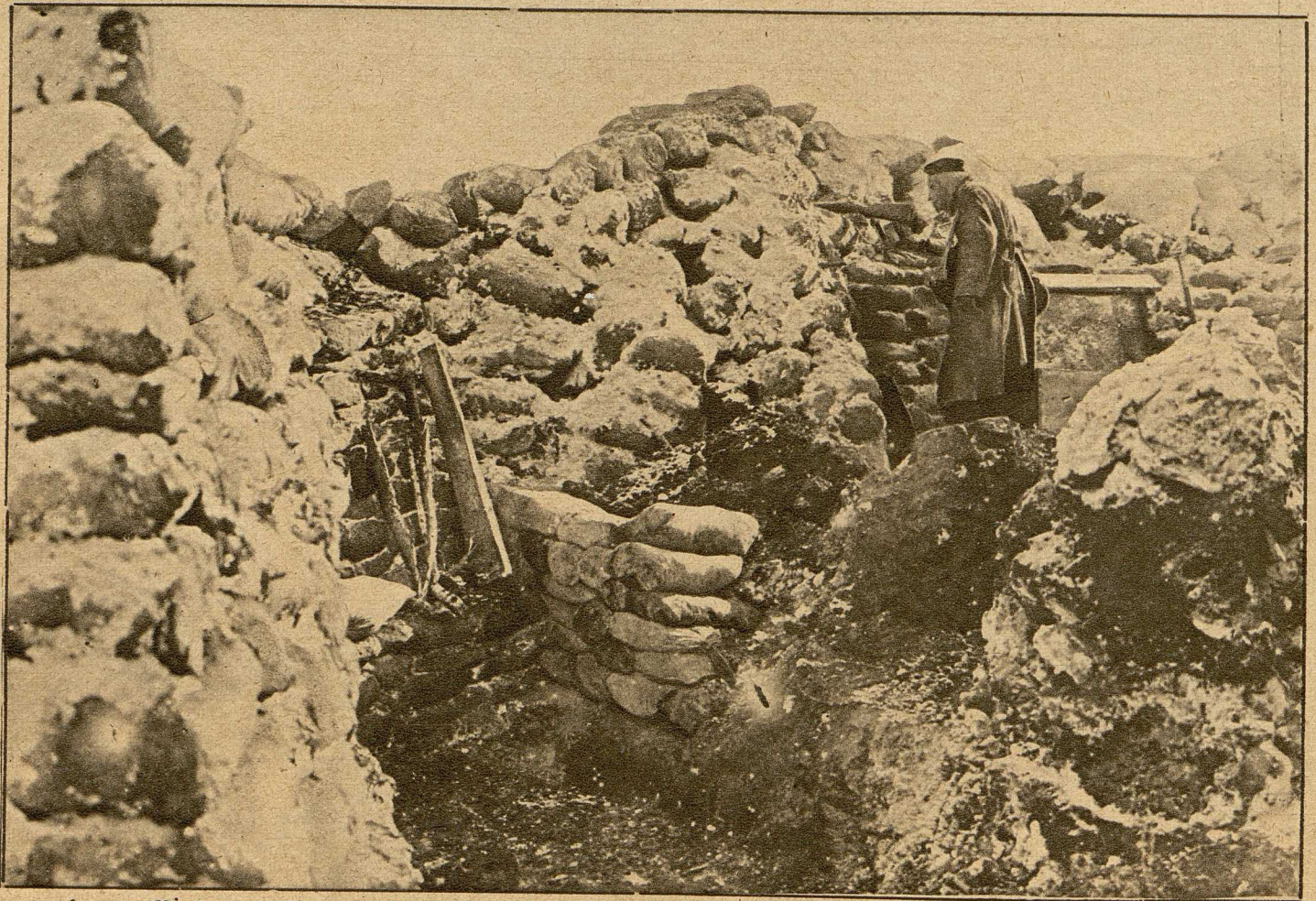
Rand eines Sprengtrichters an der Ostfront, der von deutschen Soldaten besetzt und ausgebaut wurde.

verlust zu bereiten. Schwierig und gefährvoll ist das Unternehmen, ehe es zum Sprengen eines Trichters kommt. Die Hauptarbeit beginnt aber erst nach vollzogener Sprengung: die Behauptung oder die Einnahme des Trichters, sein Ausbau und seine Instandsetzung zur Verteidigung gegen die sofort einsetzenden Angriffe des Gegners. Einen solchen ausgebauten Trichter zeigt das Bild unten.