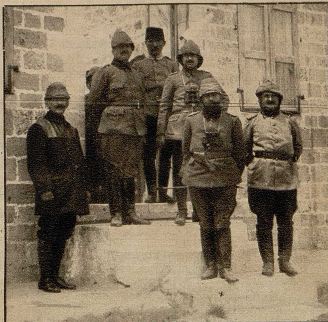
Djemat Pascha (X), der Oberkommandierende der türkischen Truppen in Mesopotamien.