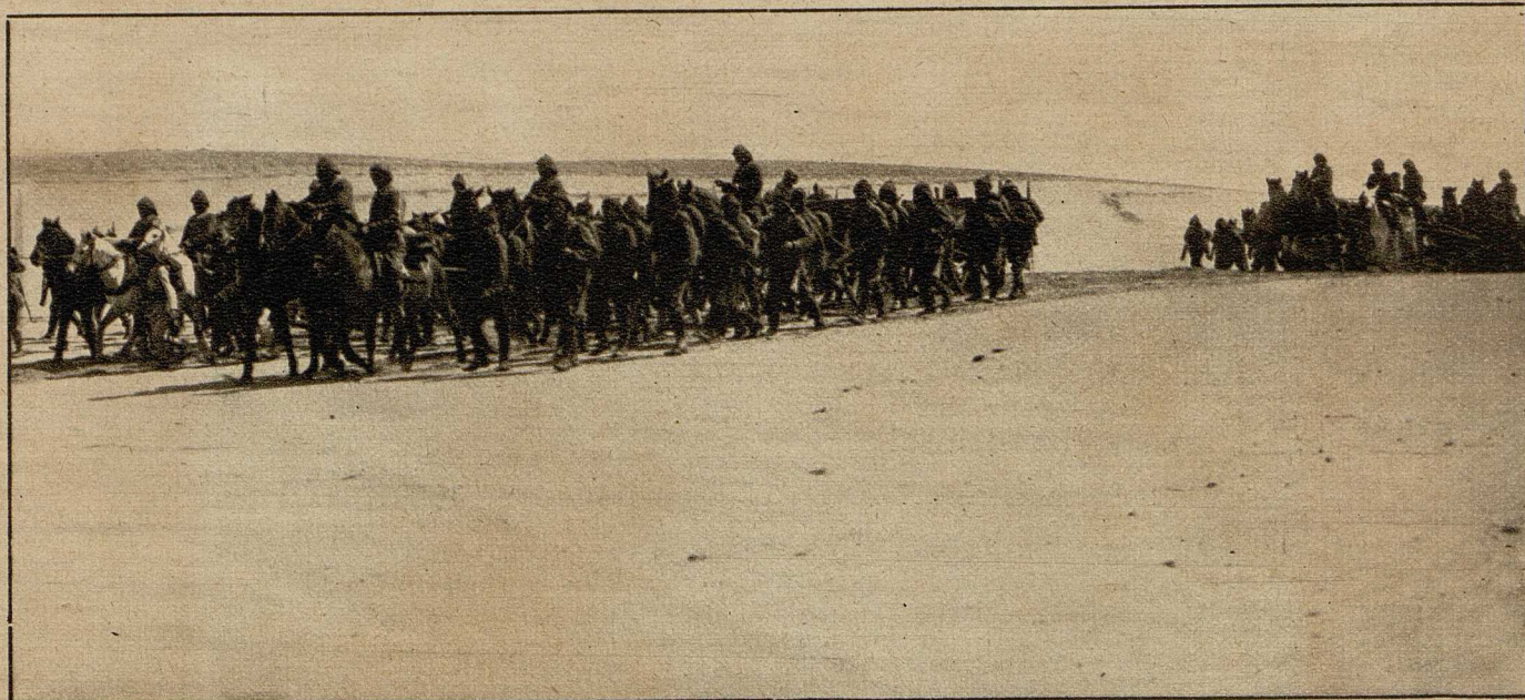
Türkische Truppen auf dem Vormarsch südlich von Bagdad, wo die Engländer eine große Niederlage erlitten.