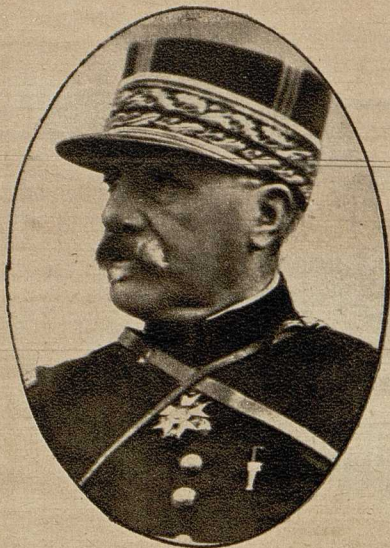
Der französische General Gastelnau wurde mit der Leitung der Operationen an der französischen Nordostfront betraut.