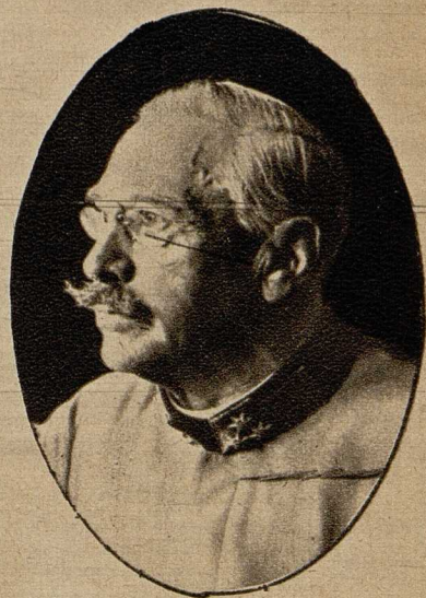
FML. Danll, der Tiroler Landesverteidigungskommandant. (Phot. F. O. Koch.)