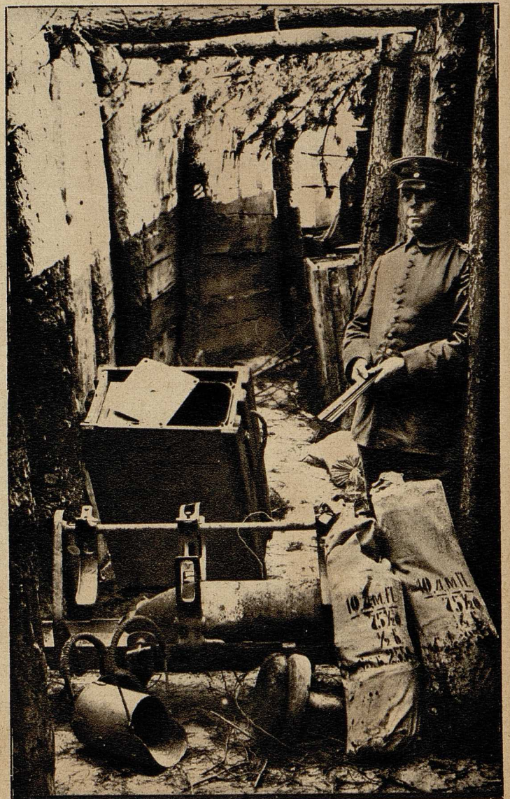
Vorrichtung zur Entsendung von Gasen, die in einem russischen Schützengraben gefunden wurde und die Verwendung giftiger Gase durch die Russen beweist.