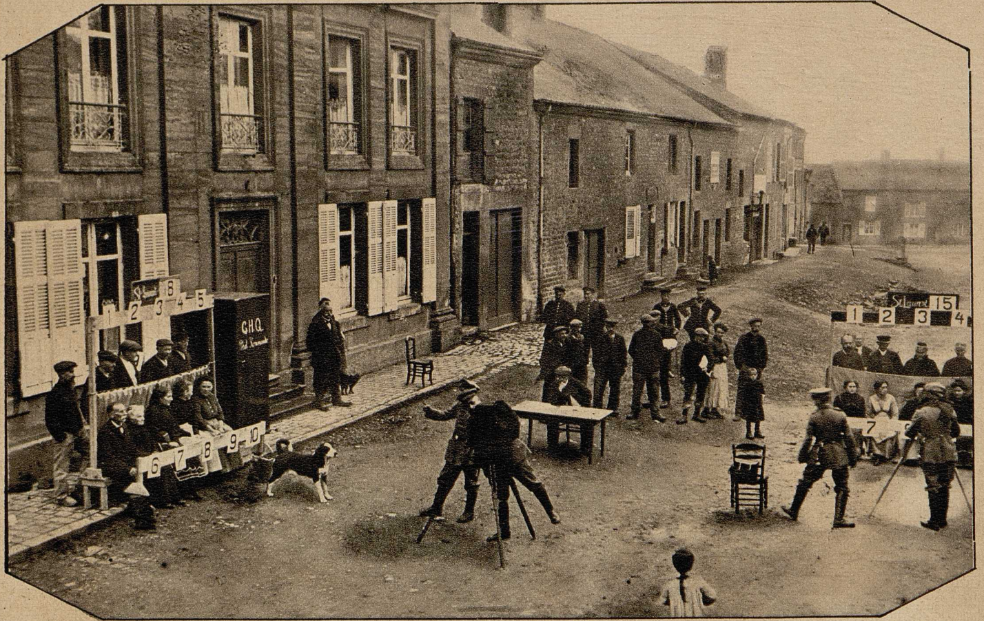
Photographischer Großbetrieb in einem französischen Dorfe: Es hat sich als notwendig erwiesen, in einzelnen Etappen der besetzten nord-französischen Gebiete den Paßzwang mit Photographien einzuführen. Zur Beschaffung der Photographien stellte die Militärverwaltung Soldaten (Berufsphotographen) an, welche die Einwohner in Gruppen zu je zehn Personen aufnehmen.