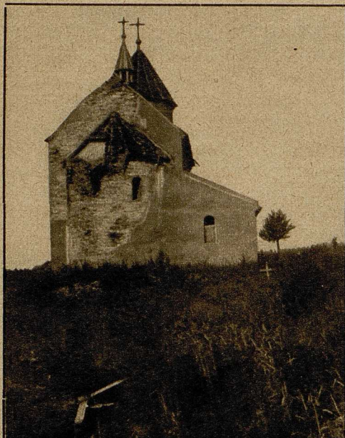
Die auf einer Höhe gelegene Kirche, die als einziges Gebäude nur wenig beschädigt ist.