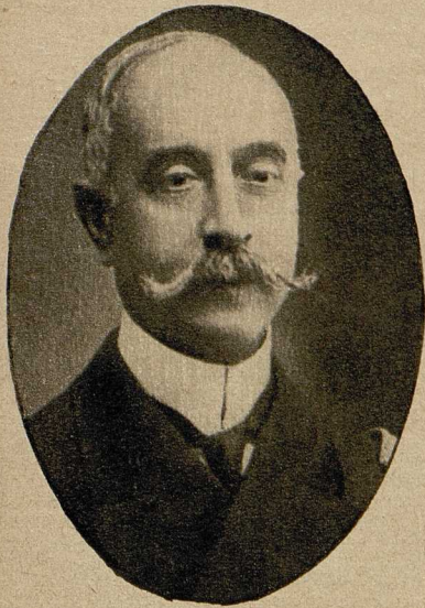
Der griechische Vizeadmiral Conduriotis übernahm an Stelle des englischen Admirals Kerr den Oberbefehl über die griechische Flotte.