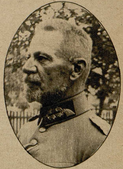
General von Gallwitz, der siegreiche Führer der deutschen Truppen an der Narew-Linie.