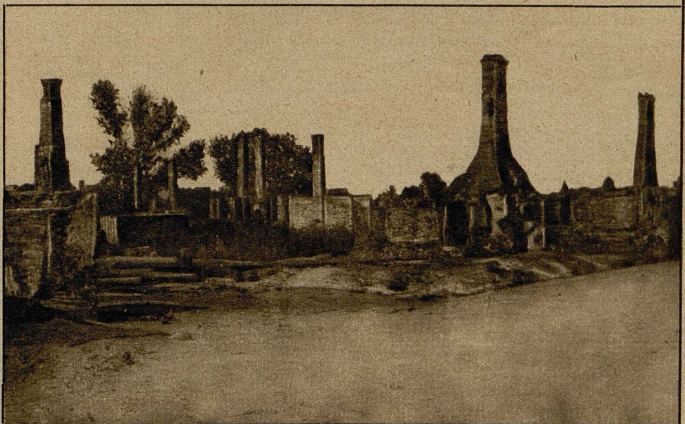
Die tote Stadt Znowlody (Russisch-Polen), die von den Russen völlig zerstört wurde.