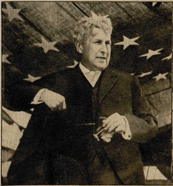
Der Kriegsminister der Vereinigten Staaten, Garrison.