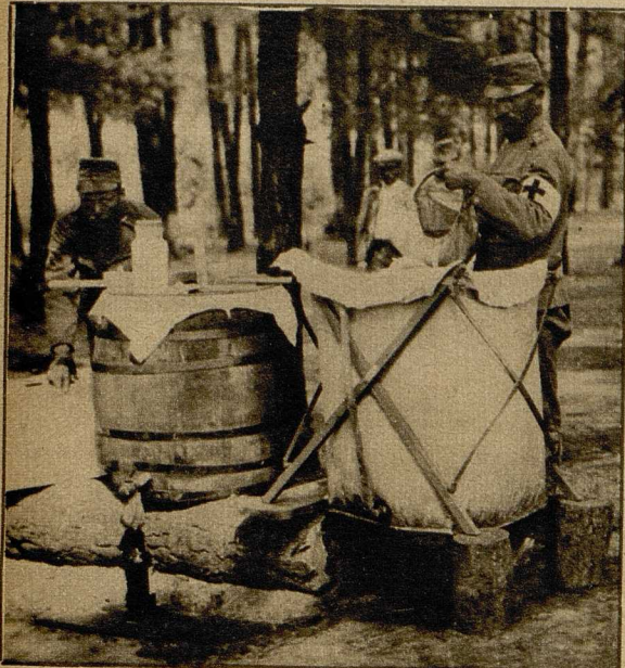
Oesterreichisch-ungarische Sanitätsoldaten filtrieren Trinkwasser.

meines jungen Lebens, und ich bewahre ihm ein inniges Andenken. Aber wie alle edlen Seelen besaß auch mein Esel keine Reider. Diese erklärten mir, daß ein Roß doch nobler sei als ein Esel. Mein Esel hatte nämlich eines Tages einen natürlichen Sohn, der als Maultierchen zur Welt kam, da seine Mutter eine Pferdlin war. Dies niedliche Maultier war ungeraten genug, mehr nach seiner liederlichen Mutter zu arten, sie nachzuahmen, statt sich zu seinem Eselwater zu bekennen. Es wieherte, statt J—ahh zu sagen. Die Reider aber sprachen: „Was willst du, Achmed; ein Maultier spricht lieber von seiner Mutter, der Pferdstute, als von seinem Vater, der ein Esel war.“