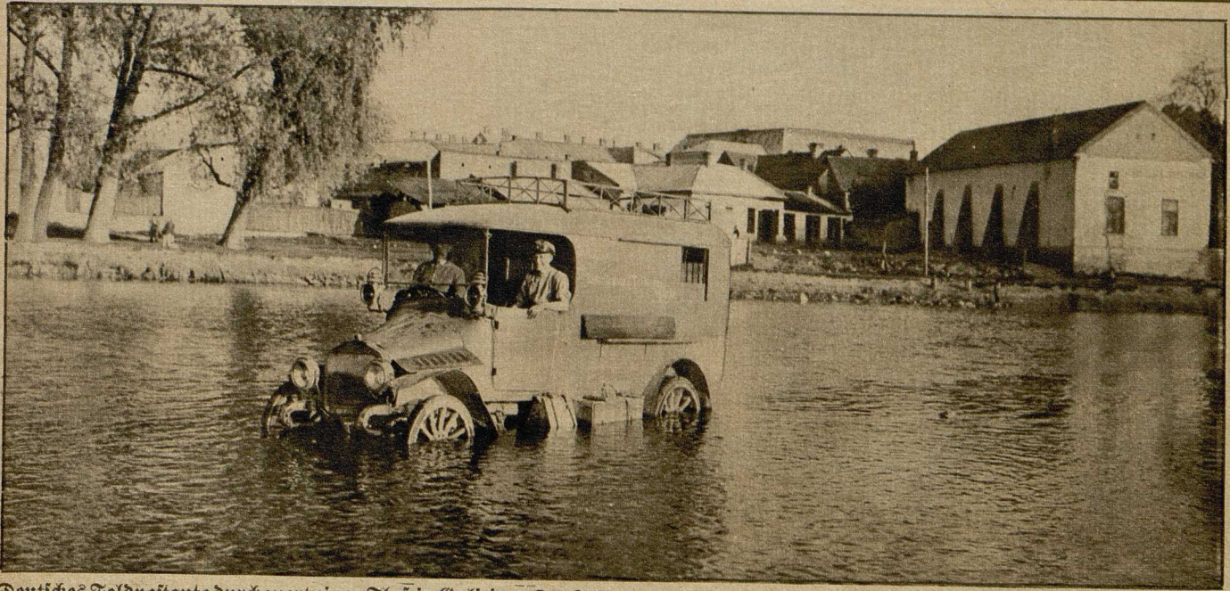
Deutsches Feldpostauto durchquert einen Fluß in Galizien. Das Fehlen der durch die Russen zerstörten Brücken erschwert vielfach den militärischen Verkehr.