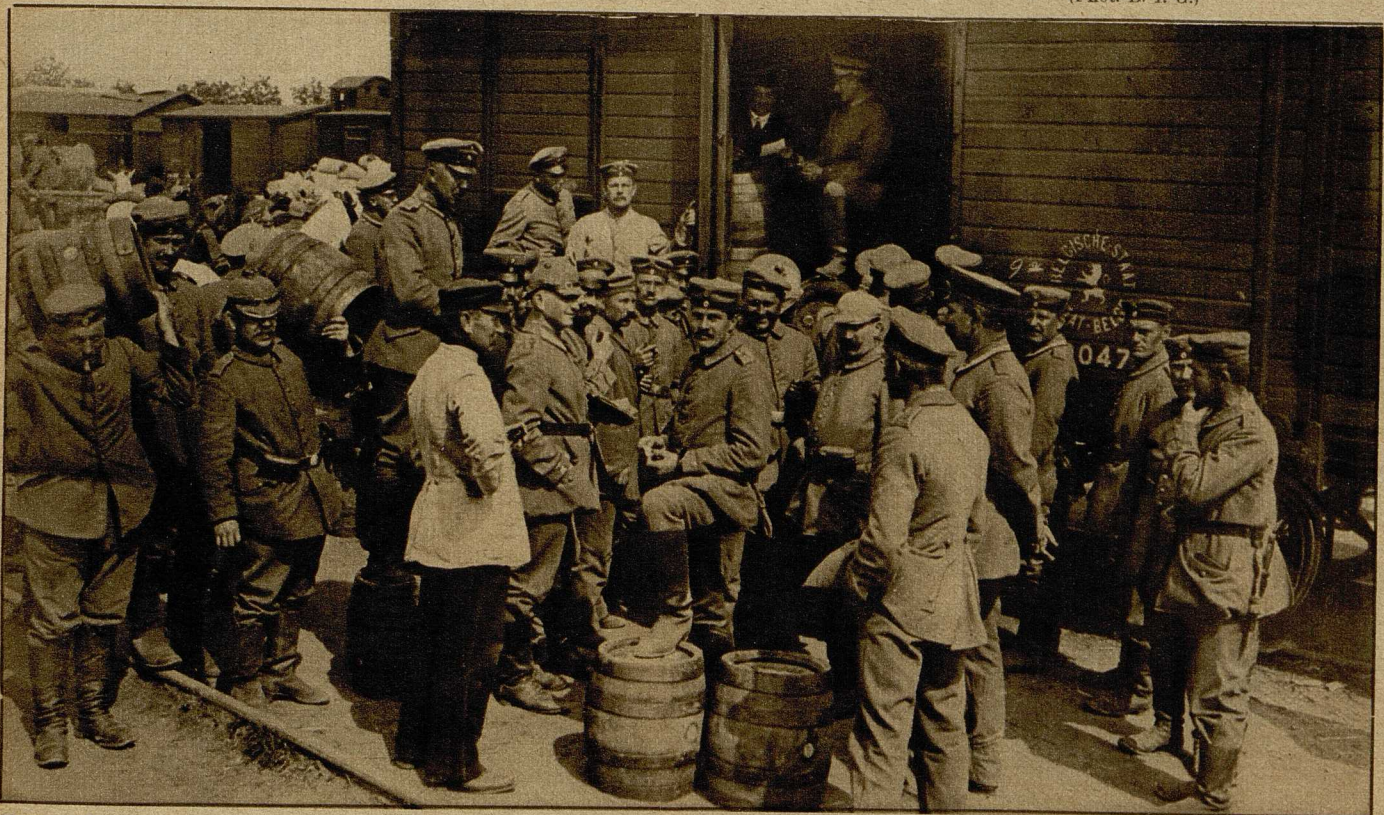
Verproviantierung unserer Truppen. Ausladen des von vielen Feldgrauen heiß ersehnten Bieres auf einem Güterbahnhof in Russisch-Polen.