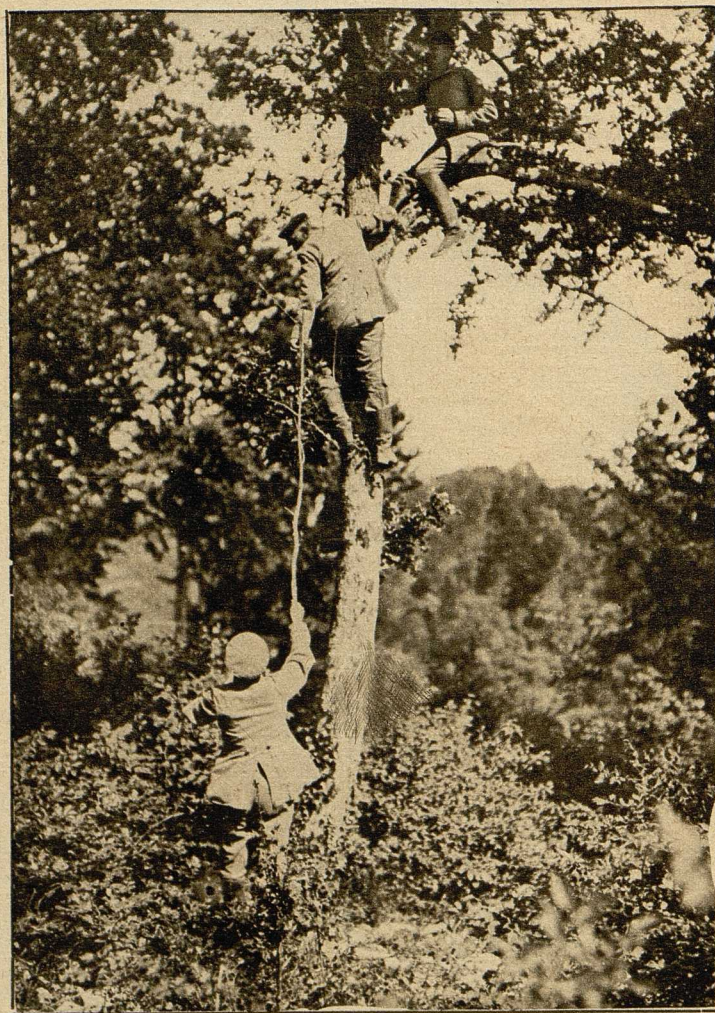
Deutscher Beobachtungsposten im Walde bei der Tranchee (auf der Cote Lorraine), wo die Franzosen seit einigen Tagen wieder größere Durchbruchversuche unternahmen.