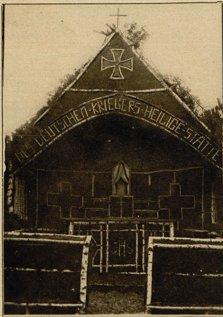
Aus Birkenstämmen und Tannenreisig von deutschen Pionieren auf dem westlichen Kriegsschauplatz erbaute Waldkapelle.

mit „Bomben, die mit erstickenden Gasen gefüllt waren“. Der Gedanke, den Gegner durch derartige Gase zu vertreiben, ist durchaus kein neuer. Die Heimat der Stinkbombe ist eigentlich der sonnige Süden, wo sie für private Zwecke recht fleißig benutzt wird. Wenn die Braut untreu geworden ist, der wirft ihr am Hochzeitstag einige Kügelchen auf die