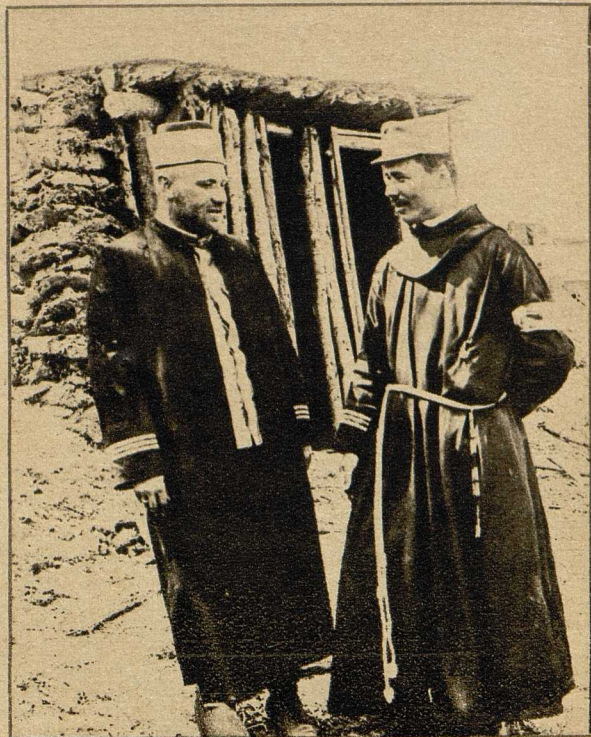
Ein mohammeda- nischer und ein katholischer Feld- geistlicher bei den bosnischen Regi- mentern vor Brzemyśl.