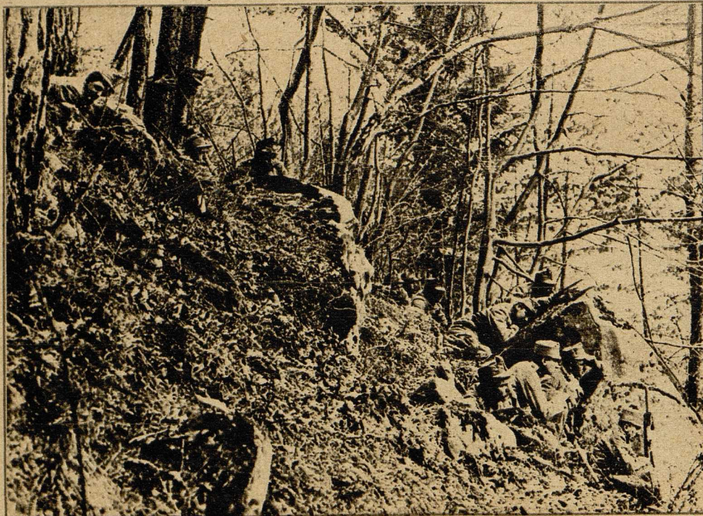
Vom Kriege mit Italien: Oesterreichisch-unga- rische Patrouille in einem Walde an der italienischen Grenze bei der Beobachtung des Feindes.