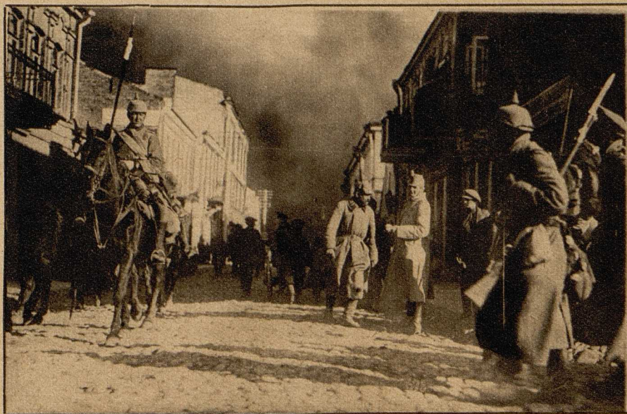
Aus dem brennenden Szawle. Deutsche Soldaten sorgen für Ordnung und helfen den Einwohnern bei der Rettung ihrer Habe.

Der Lichtschein bleibt an ihm haften und verfolgt ihn auf seiner weiteren Bahn, das Ziel, auf das nunmehr die Mündungen der Abwehrkanonen gerichtet werden, stets hell beleuchtend. Dieses Abfuchen des nächtlichen Himmels, das sich gegenwärtig