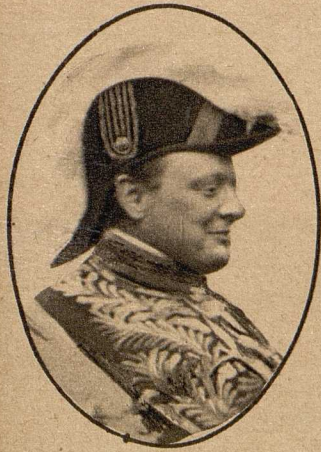
Winston Churchill , der englische Marineminister, legt sein Amt nieder, bleibt aber in der Regierung.