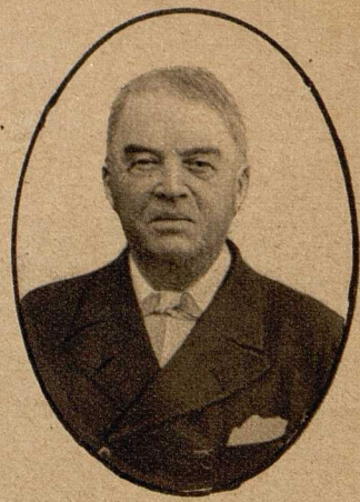
Lord Fisher , Erster Seelord der britischen Kriegsmarine, tritt zurück

Scheinwerfern aber noch eine besondere Rolle erwachsen. Sobald das Nahen gegnerischer Luftschiffe oder Zieger zu befürchten ist, werden ihre Strahlen nach oben gelenkt, um diese so rechtzeitig zu entdecken, daß man sie mit Erfolg beschießen kann. Ist ein Luftschiff oder ein Zieger in den Lichtkegel des Scheinwerfers gelangt, so geht es ihm wie dem Torpedoboot.