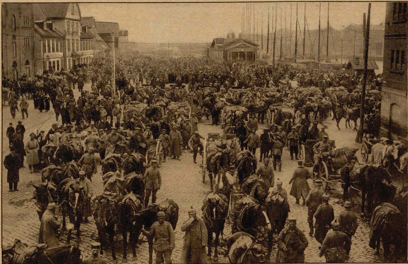
Der Hafenplatz in Libau nach dem Einrücken der deutschen Truppen.

auf den Schlachtfeldern sowohl wie in Festungen und in Häfen, in denen die Kriegsflotte ankert, ständig wiederholt, stellt ein prachtvolles Schauspiel dar, das für den, der es jemals erblickt, immer unvergesslich bleiben wird. Die so vielseitige Verwendung des Scheinwerfers bedingt eine ebenso vielseitige Ausgestaltung der für seine Handhabung nötigen Einrichtungen. Die Truppen führen sogenannte "Scheinwerferzüge" mit sich, die aus zwei Wagen bestehen. Der eine enthält den Motor, der eine Dynamomaschine in Umdrehungen versetzt und dadurch den zur Erzeugung des Lichtes nötigen elektrischen Strom liefert. Der andere Wagen trägt den eigentlichen Scheinwerfer,