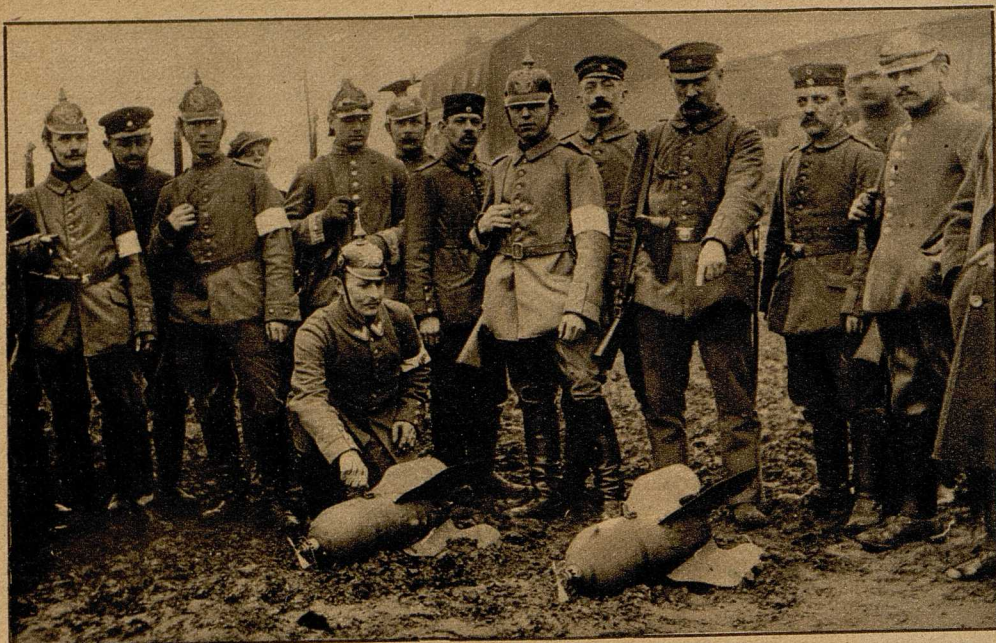
Englische Fliegerbomben, die ein in den Kämpfen bei Ypern zum Landen gezwungenes englisches Flugzeug mit sich führte.