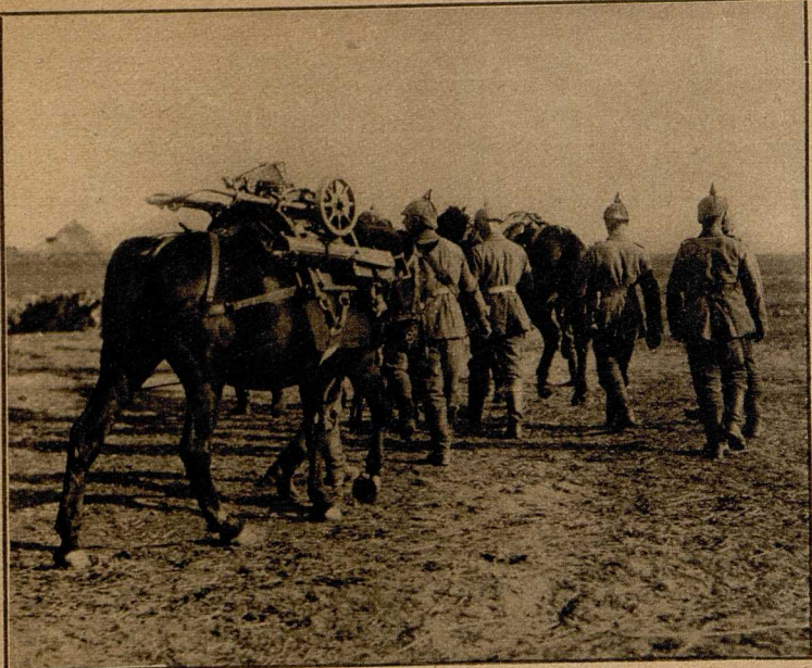
Maschinengewehre auf Pferden, eine praktische Einrichtung, die jetzt auch beim deutschen Heere eingeführt wurde.