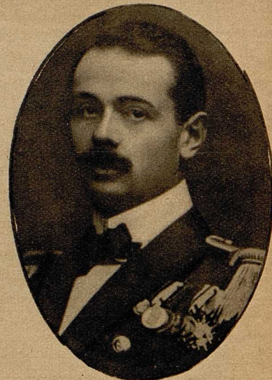
Linienfahrtsleutnant Ritter v. Trapp, Kommandant des österreichischen Unterseebootes U 5, das den französischen Panzerkreuzer „Leon Gambetta“ versenkte.