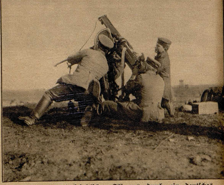
Beschießung eines feindlichen Fliegers durch ein deutsches Maschinengewehr.