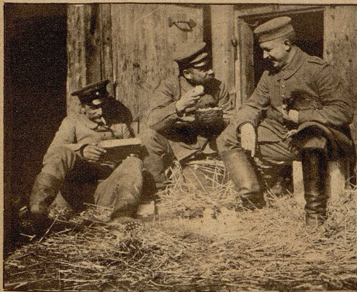
Die erste Kostprobe beim Auspacken der Pakete.

zu erreichen sind und als Ruhequartiere für die Truppen dienen. Der Zug besteht aus Lokomotive, dem Wasserwagen, drei Badewagen, einem An- und Auskleidewagen und einem Wohnwagen für das Personal des Zuges. Das Wasser im Wasserwagen wird durch den Dampf der Lokomotive erhitzt und in die Badewagen gedrückt. Der erste Wagen, enthält 10 Brausen und ein Wannenbad für Offiziere, die beiden anderen haben je 16 Brausen.