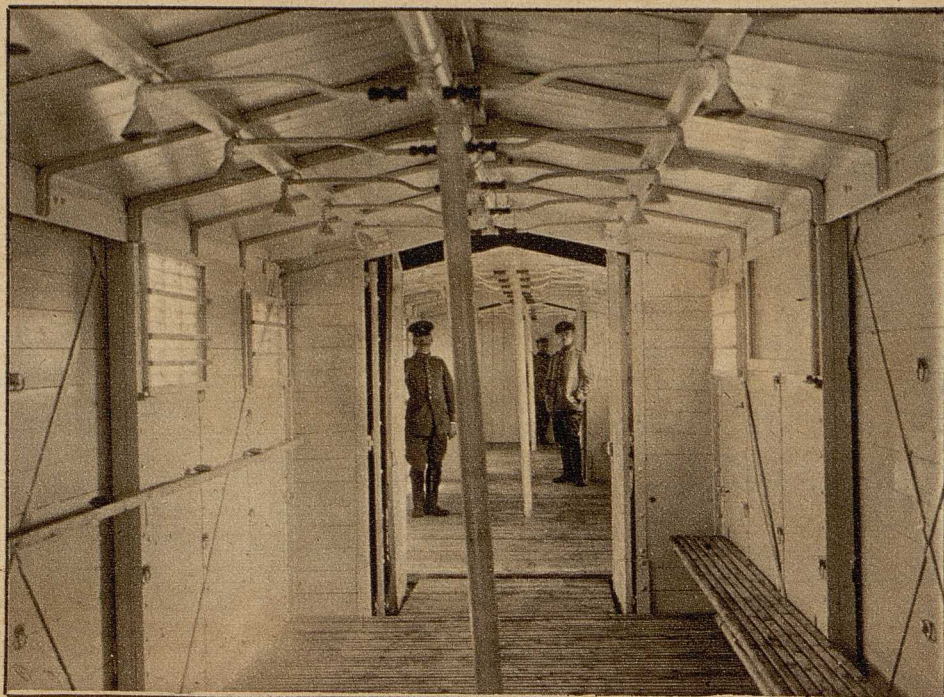
Das Innere der Badewagen mit den an der Decke angebrachten Brausen.

Um den Truppen in der Front an ihren Ruhetagen die Möglichkeit zu geben, ein Bad zu nehmen, und gleichzeitig auch um Krankheiten vorzubeugen, ist bei dem 1. Bayerischen Reserve-Korps ein Badezug geschaffen worden, der bis in die Ortschaften hinter der Front fährt, die noch mit der Bahn