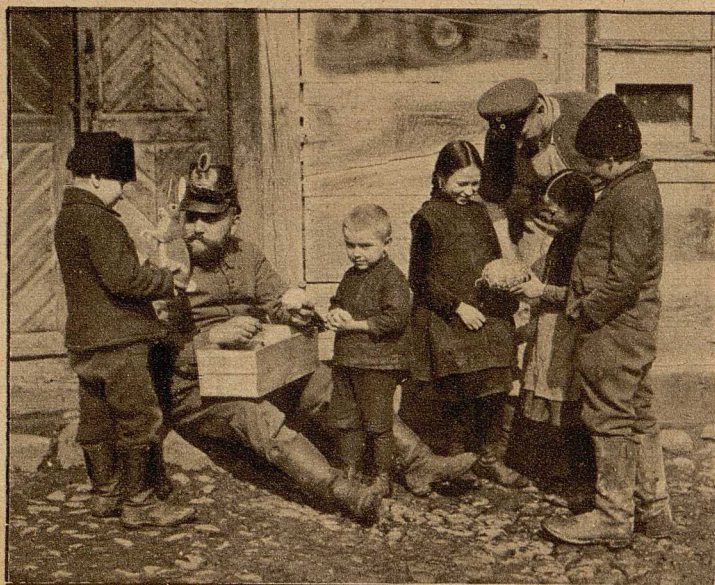
Nach dem Eintreffen der ersten Oster-Liebesgaben bei unseren Feldgrauen.