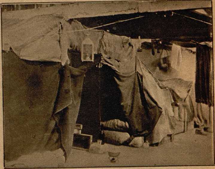
Aus dem Gefangenenlager in Périgueux, (Frankreich). In einer alten verwahrlosten Perlenfabrik sind die Zivilgefangenen untergebracht. Die Räume sind derartig feucht und regendurchlässig, daß die einzelnen Familien sich dadurch zu helfen versuchten, daß sie kleine primitive Kabinen errichteten.