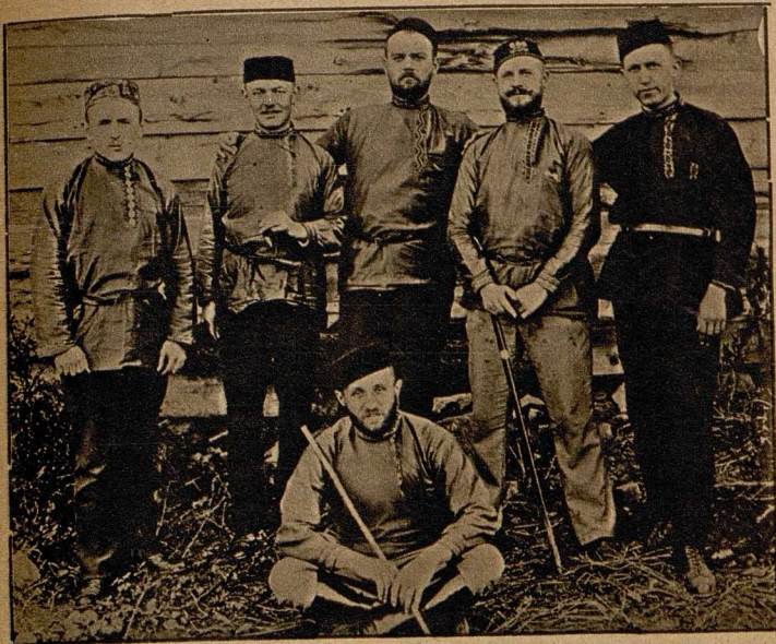
Eine Gruppe von deutschen Zivilgefangenen in Ceitowsthe bei Orenburg in Süd-Rußland.