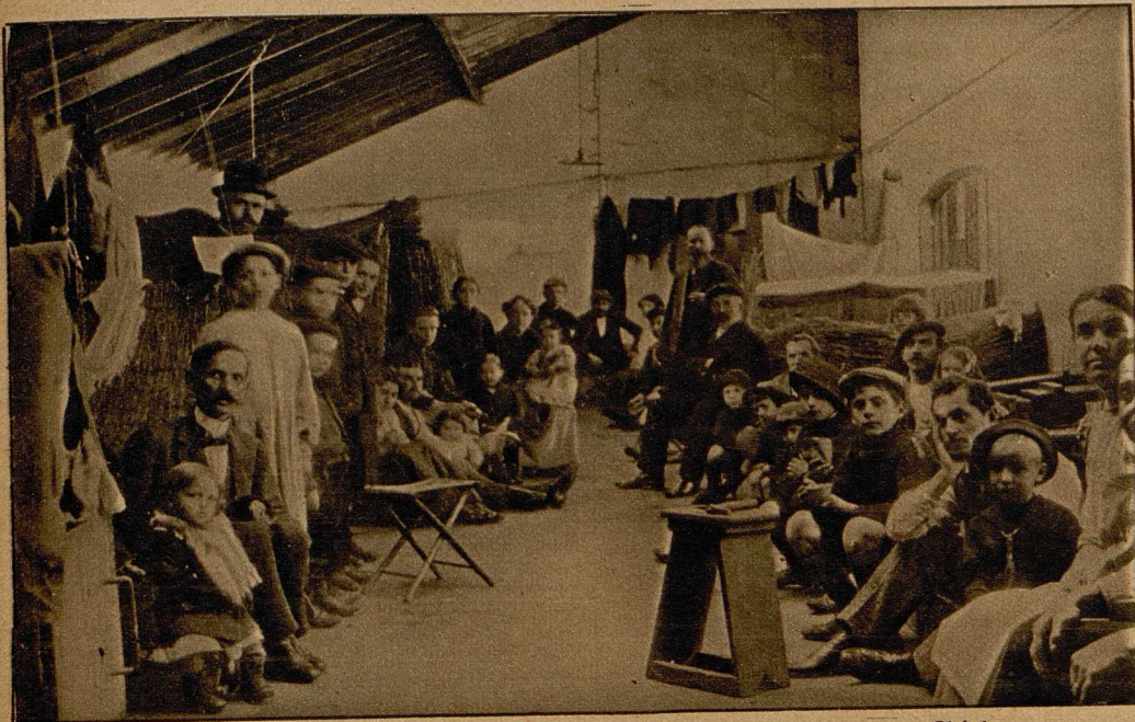
Der Raum für die Oesterreicher und Ungarn im Gefangenenlager von Périgueux.