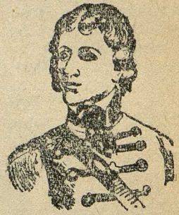
Thaddäus Kosciuszko. Polnischer Freiheitskrieger geb. 1746, gest. 1817

socht als Anhänger der Kon- stitution von 1791 unter Josef Kosciuszki gegen die Russen bis zur Niederlage bei Dubienka 1792.