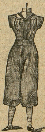
Geschlossenes Beinkleid mit Rockträger. (Vorderansicht.)