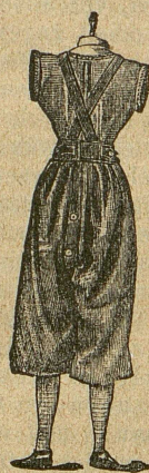
Geschlossenes Beinkleid mit Rockträger. (Hinteransicht.)