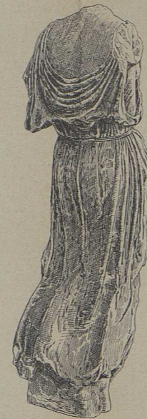
4. Nike des Bryaxis (Athen) [S. 652].

2 u. 3. Zwei Seiten der Reliefbasis des Bryaxis (Athen) [S. 652].