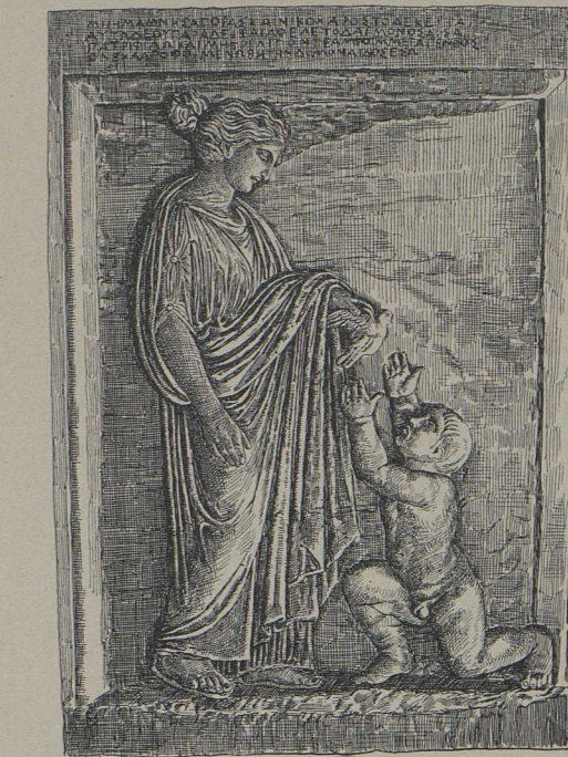
6. Grabstele der Geschwister Mnesagora und Nikochares (Athen).