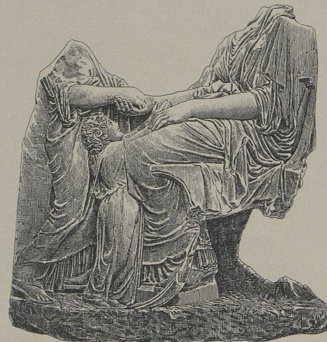
9. Grabfragment einer Frau mit ihrer Familie (Athen).