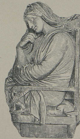
8. Grabmal einer Frau von Menidhi (Athen).