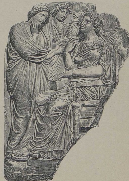
10. Grabstele einer Mutter (Athen).