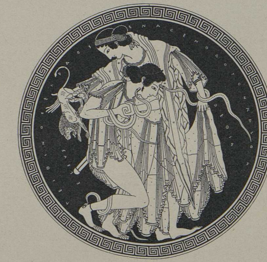
11. Innenbild einer rotfigurigen Schale des Peithinos (Berlin): Ringkampf zwischen Peleus und Thetis, welche sich in Tiere verwandeln [S. 618].