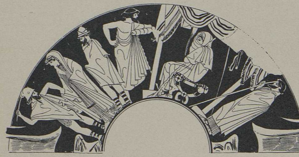
9. Rotfigurige Schale, dem „Meister mit dem Kahlkopf“ zugeschrieben (Brit. Mus.): Wegführung der Briseis [S. 618].