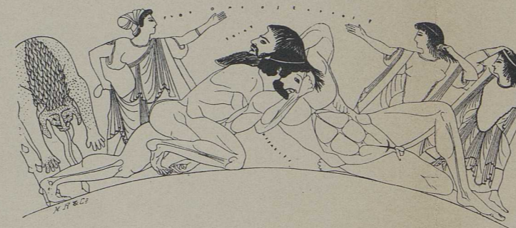
2d. Von dem rotfigurigen Antaios-Krater des Euphronios (Louvre): Kampf des Herakles mit Antaios [S. 617].