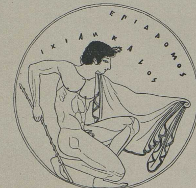
5. Innenbild einer rotfigurigen Schale des Kachrylion: Sich verteidigender Jüngling [S. 617].