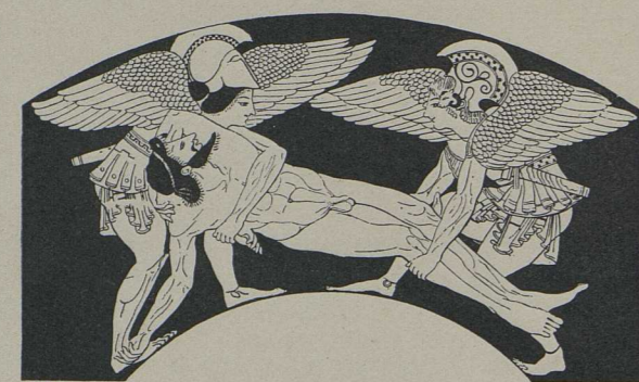
6. Von einer rotfigurigen Schale des Pamphaios (Brit. Mus.): Schlaf und Tod tragen den Leichnam des Sarpedon oder Memnon hinweg [S. 617].