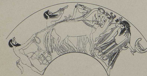
10. Fragment einer rotfigurigen Schale des Oltos (Louvre): Bakchischer Thiasos [S. 618].