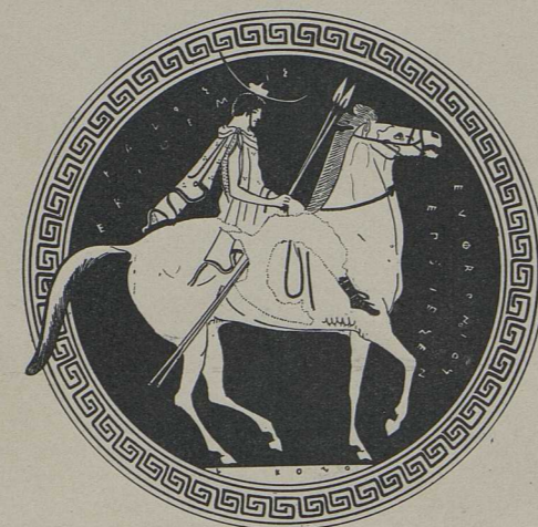
7. Innenbild einer mit dem Signet des Euphronios bezeichneten Schale [des Onesimos?] (Louvre): Berittener Ephebe [S. 618].