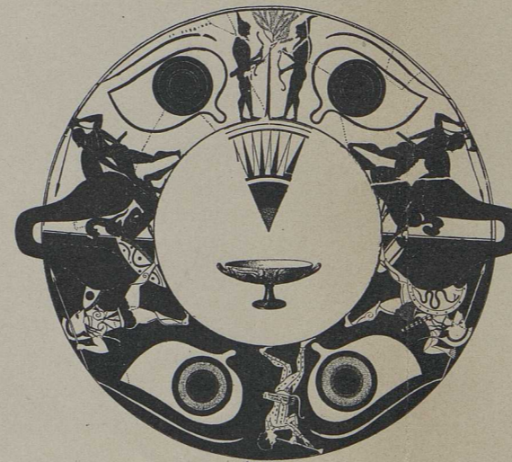
8. Schale des Andokides mit Kampfszenen, in doppelter Technik, die eine Seite schwarz-, die andere rotfigurig (Palermo) [S. 618].