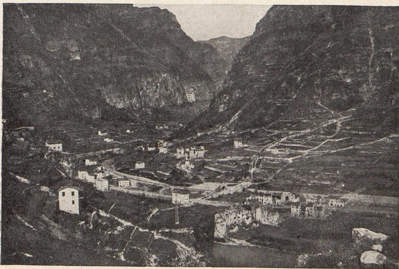
Das Brentatal bei S. Marino von Süden gesehen

Im Vordergrund ein Stück der Brenta, dann der Ort Corte, dahinter (in der Mitte) S. Marino, links am Rande Costa.