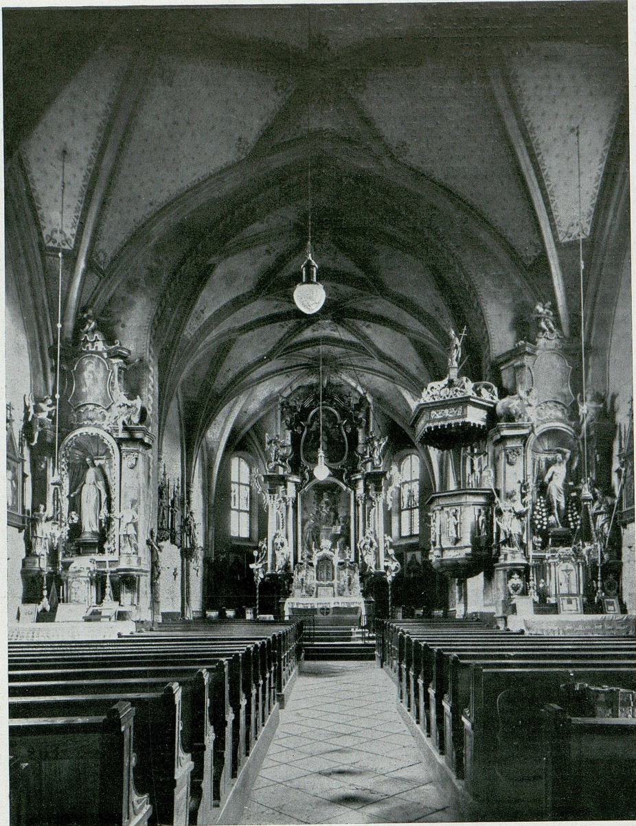
Abb. 99. Diersbach, Pfarrkirche (S. 79).